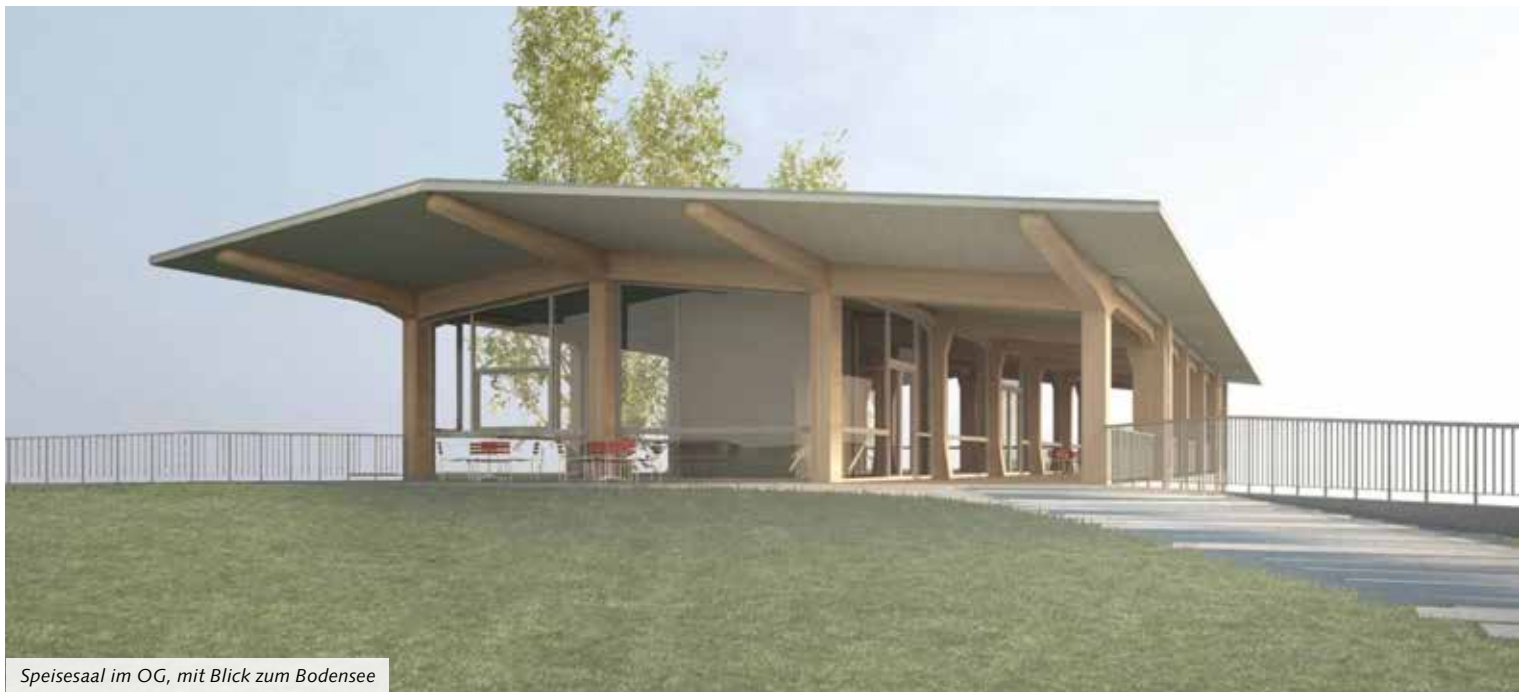
Speisesaal im OG, mit Blick zum Bodensee