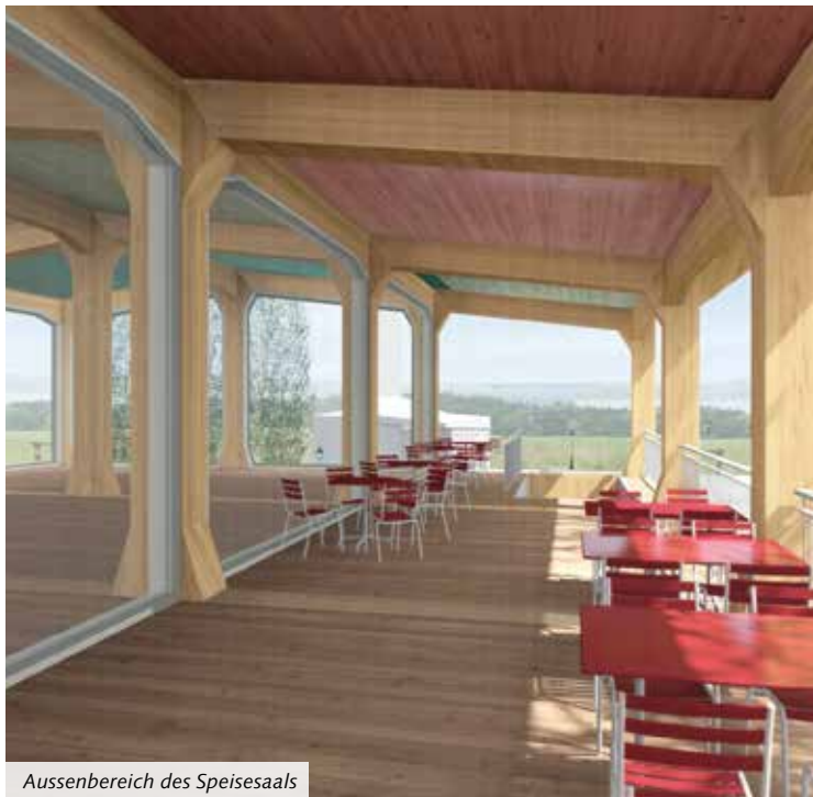
Aussenbereich des Speisesaals