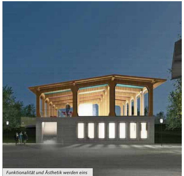
Funktionalität und Ästhetik werden eins