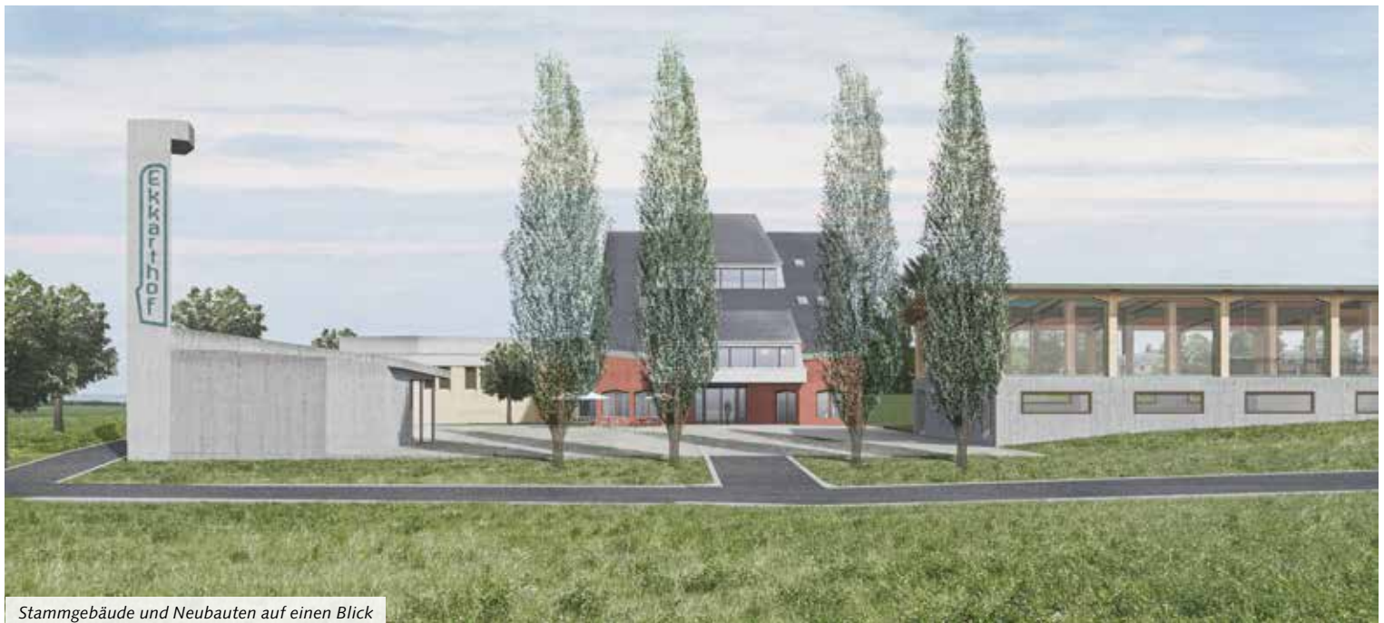
Stammgebäude und Neubauten auf einen Blick

Die veraltete Heizanlage erfährt eine Gesamterneuerung. Mit vertretbaren baulichen Eingriffen wird das Schulgebäude räumlich und sicherheitstechnisch optimiert.