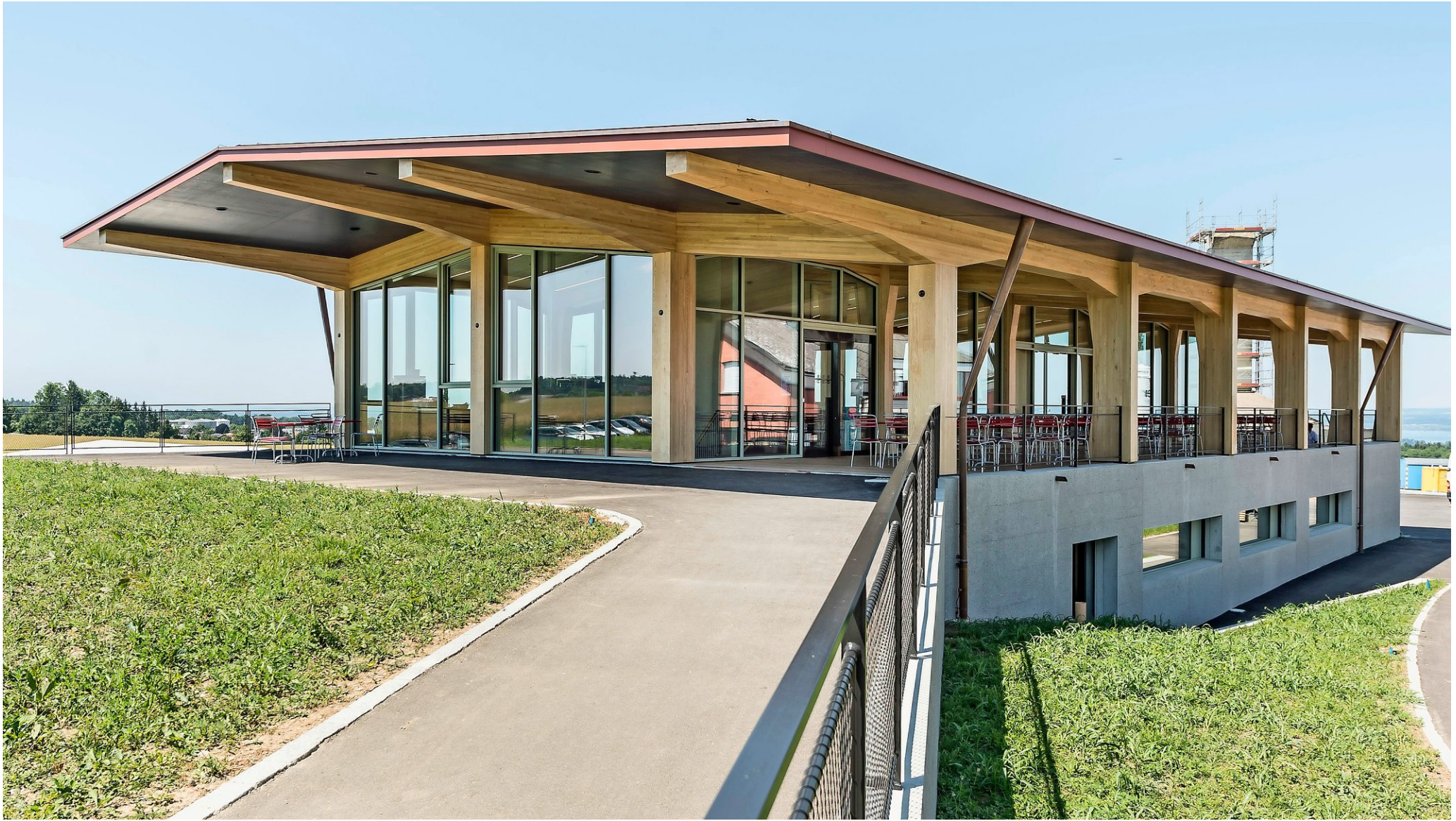
Der Esssaal mit Terrasse im Hochparterre bildet das neue Herz des sozialen Lebens im Ekkharthof